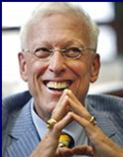
Robert J. Sternberg Yale University